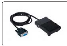
脚踏开关(选配) (用于上传数据)